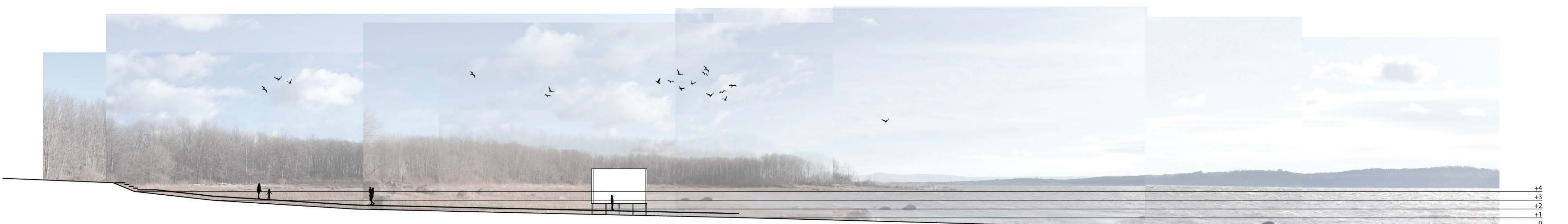
coupe longitudinale | influence des marées dans la baie

Parc des Hauts-Fonds, Saint-Augustin-de-Desmaures