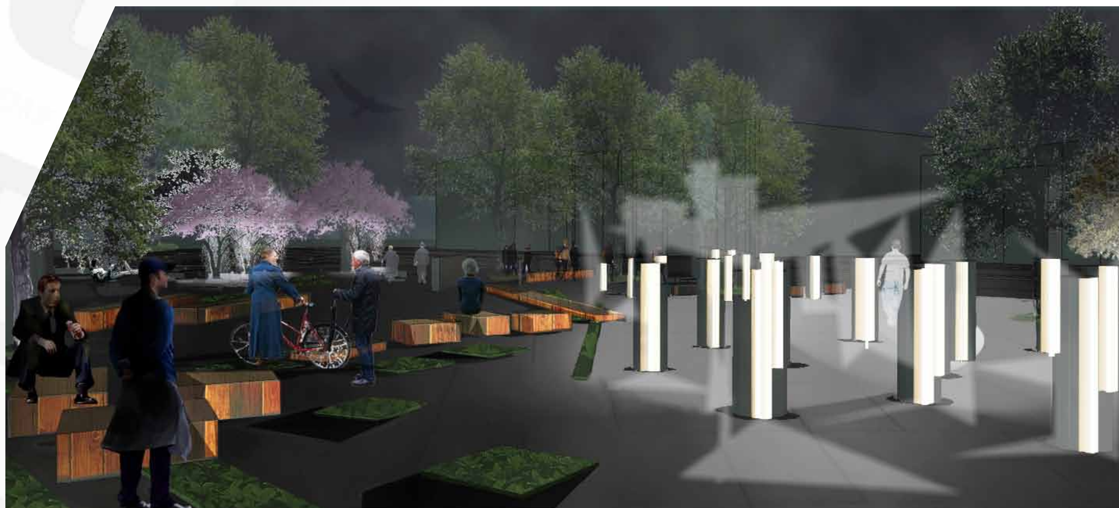
CROQUIS D'AMBIANCE NOCTURNE DE LA PLACE SOCIALE - JEUX D'OMBRE ET DE LUMIÈRE

SOUS-ESPACE D'INTIMITÉ. ENCADREMENT PAR LA VÉGÉTATION ET LE MOBILIER. CRÉATION DE PETITS ESPACES DÉLIMITÉS ET DISTINCTS. PETITES BULLES POUVANT ACCUEILLIR DIVERS USAGERS ET DIVERSES FONCTIONNALITÉS. LIEU DE CONFORT, DE RETRAIT ET D'ISOLEMENT.